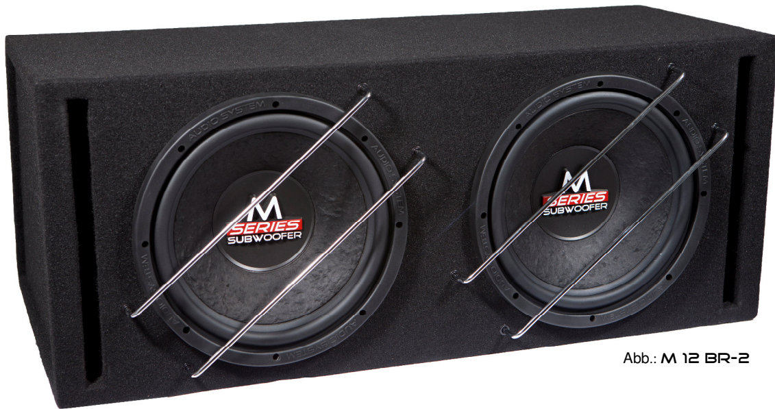
Abb.: M 12 BR-2